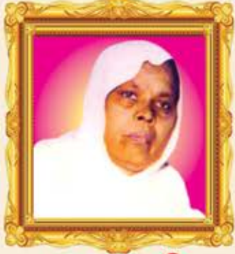
પ.પૂ.સા. શ્રી નરેન્દ્રશ્રીજી મ.સા.

કામના સત્યાનંદશાસ્ત્રી પ.પૂ.આ.ભ. શ્રી કલાપ્રભસાગરસૂરીશ્વરજી મ.સા.