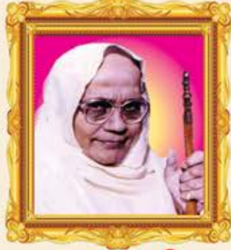
પ.પૂ.સા. શ્રી વિદ્યુતપ્રભાશ્રીજી મ.સા.