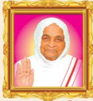
પ.પૂ.સા. શ્રી ચાક્ષતાશ્રીજી મ.સા.